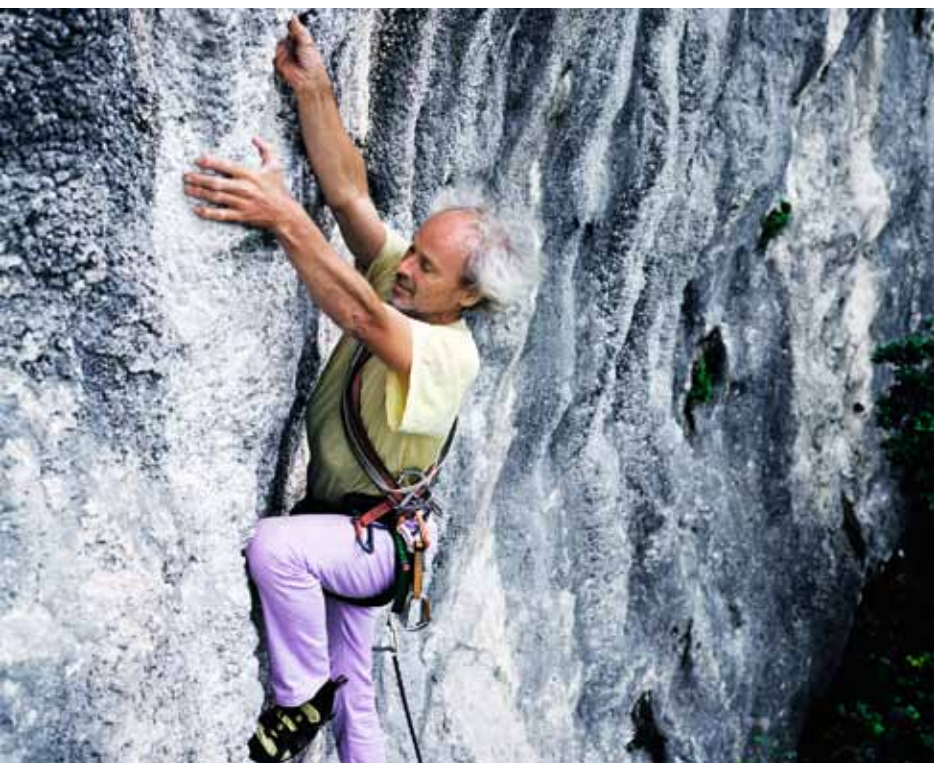
Einklang mit dem Fels: 1981 in der „Großen Micheluzzi“ (V+) am Piz Ciavazes/Dolomiten; 2012 in der „Via lo Scansafatiche“ (VI- bis VI+) am Gardasee.